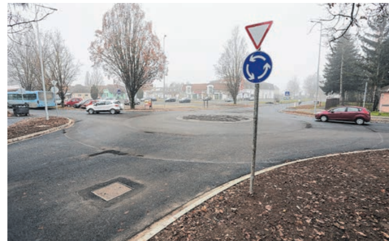
Elkészült a körforgalom a Bástyá és a IV. Béla király utca között

Az önkéntesek egyébként részt vettek az önkormányzat által biztosított szájmászok lakossághoz való eljuttatásában is. Minden háztartásba sikerült eljuttatnunk ugyanis két darab többször használatos, mosható szájmászot. Ennek