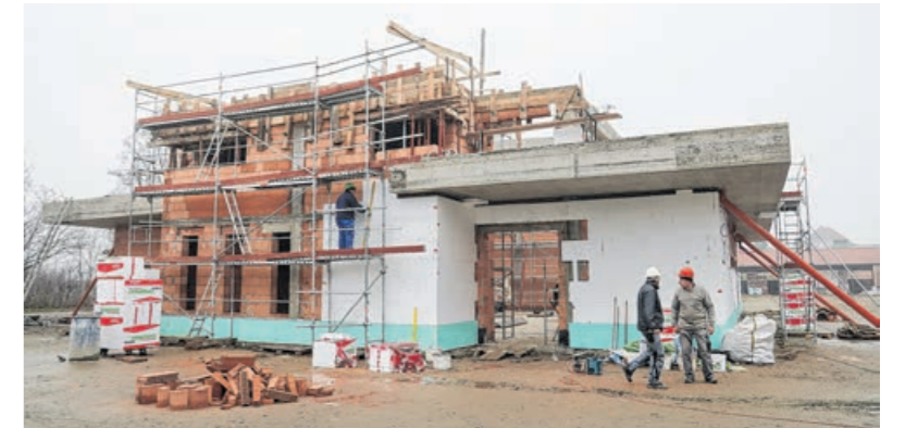
Az épülő Vásárcsarnok

- A nehéz költségvetési helyzet ellenére azért az idei évben is valósultak meg vagy kezdődtek el fejlesztések a városban. Melyek ezek?