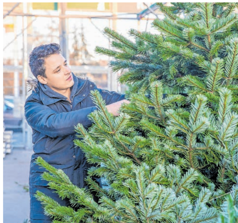
Hazánkban évente 2–2,5 millió fát adnak el karácsonyra, amelyek nagy többsége hazai termesztésű

A kékeszöld, körkörös tűskéjű, általában terebélyes ezüstfenyő már