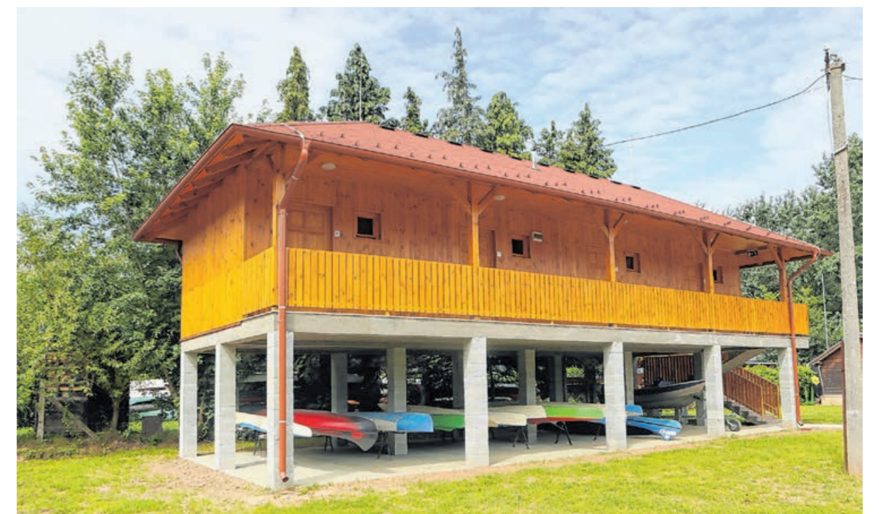
A Rába-parti turistaház