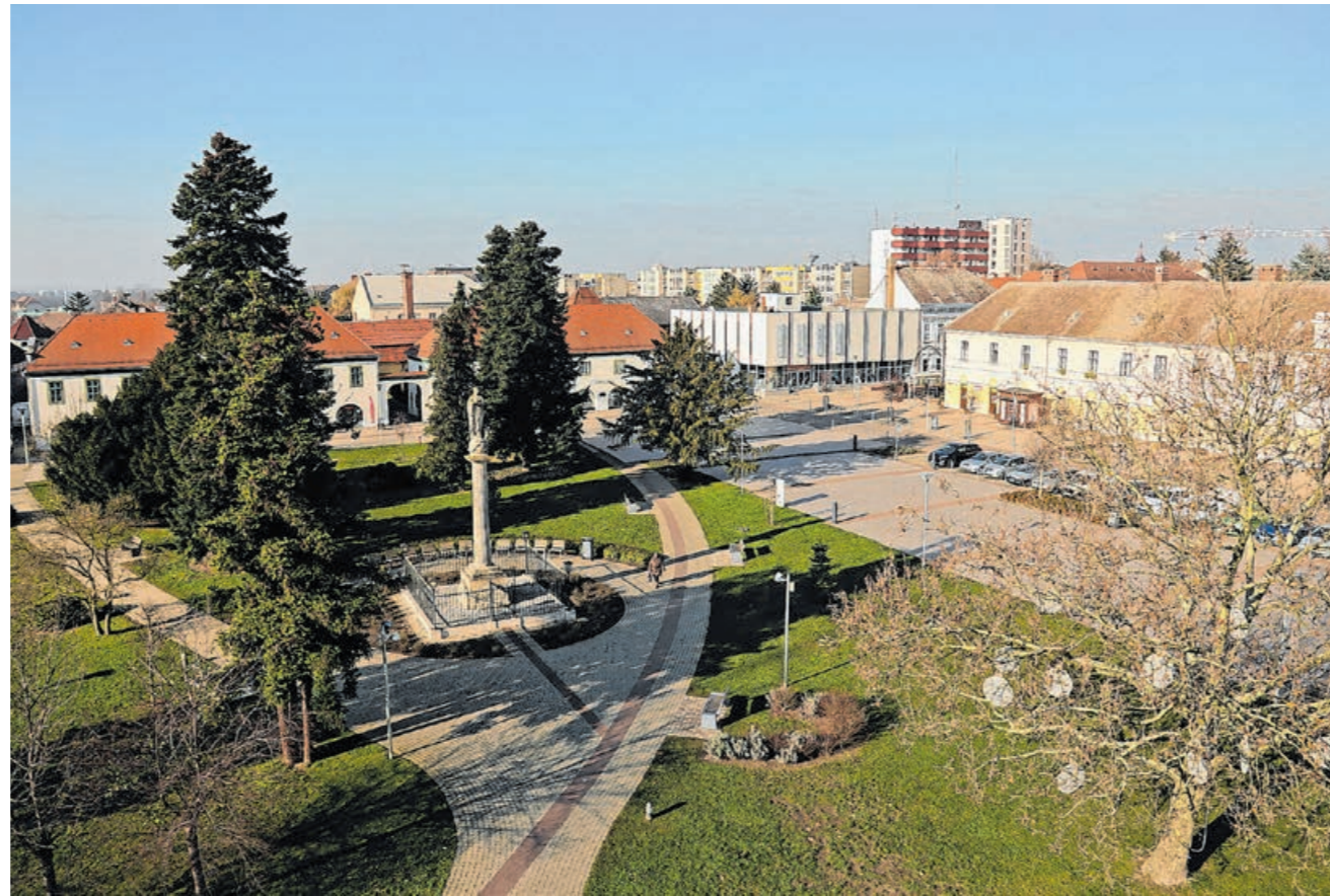
Madártávtalból a körmendi főtér

a legyártása, csomagolása és lakossághoz való eljuttatása egyébként komoly logisztikai feladat volt, amelyben az önkéntesek mellett részt vettek a szociális szféra dolgozói, a hivatali munkatársai, valamint a körmendi óvónők is. Látható tehát, hogy egy igen széles körű együttműködést és összefogást sikerült kialakítanunk a veszélyhelyzet ideje alatt – emlékezett vissza a városvezető.