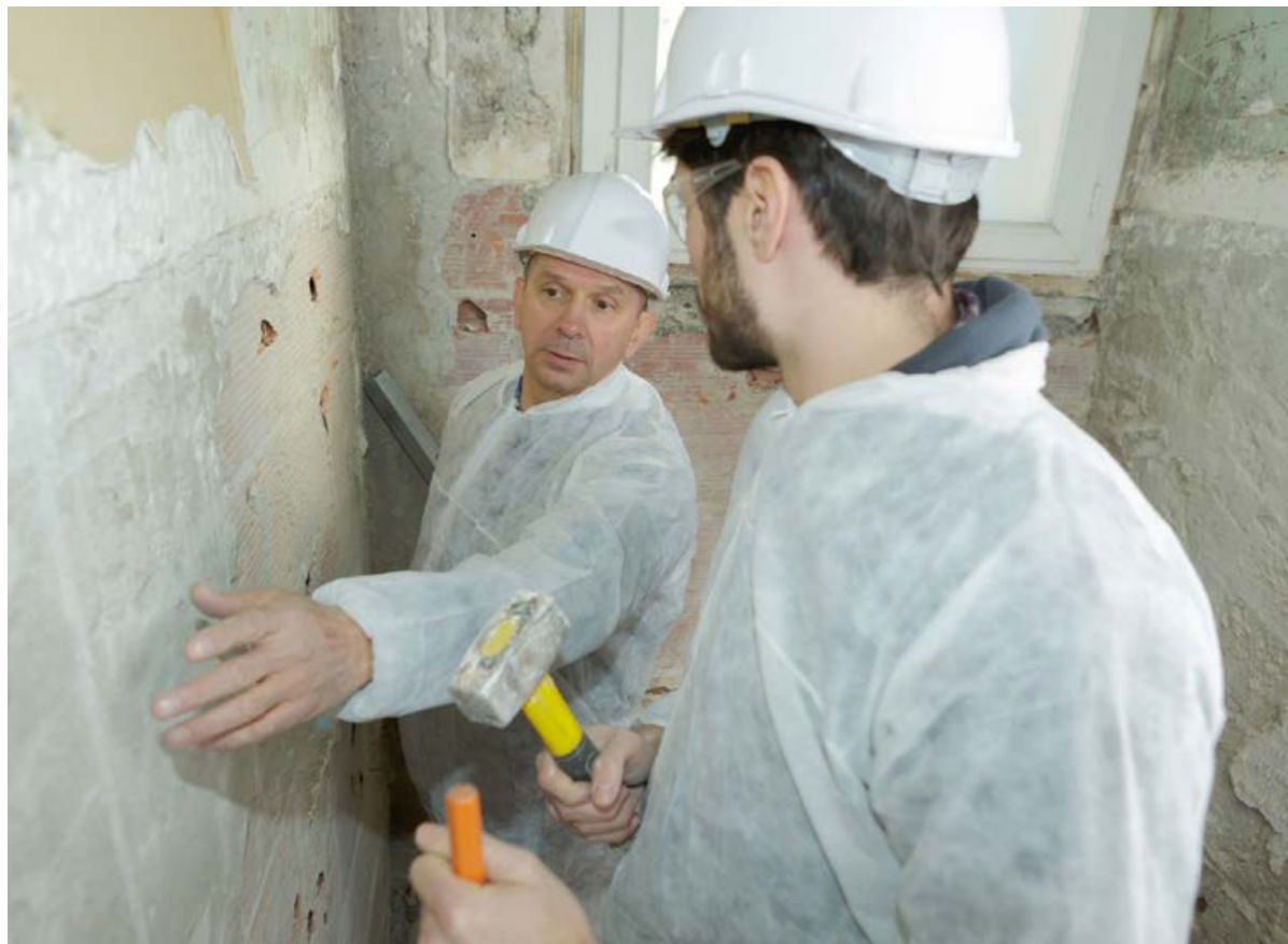
Az alapszakmákat idén januártól csak a szakképző intézményekben tanítják.