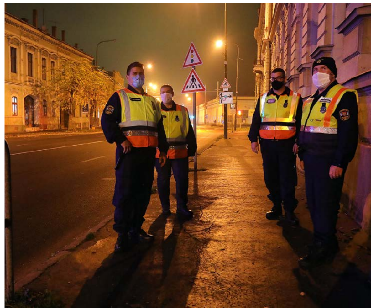
Szolgálat közben a körmen- di polgárőrök