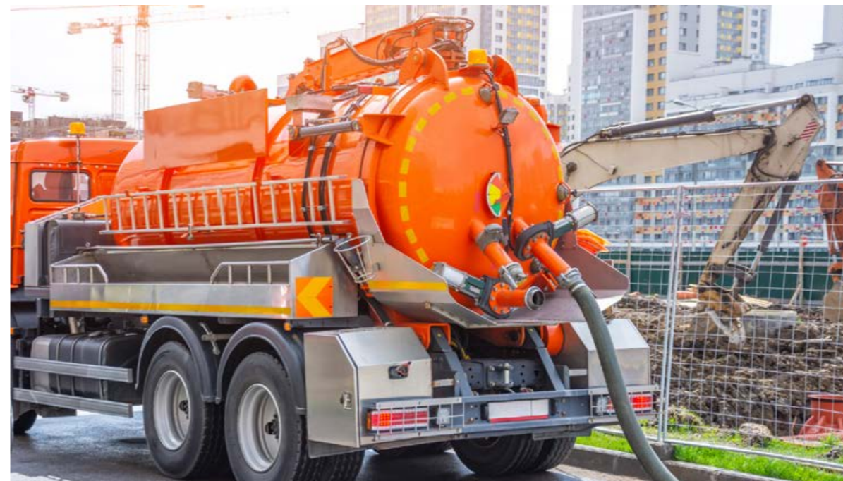
Egy makacs dugulástól komoly üzemzavar alakulhat ki, amelynek jelentős költséggel jár az elhárítása.

Bár sokan tudják, hogy a zsiradék és ételmaradékok dugulást okoznak a hálózatban, mégis minden harmadik ember a lefolyóba önti a használt étolajat vagy épp a megmaradt ebédet. De sokszor a WC-be kerül a festék, a sminklemosó pamacs, a tampon és a járványhelyzettel az arcmaszka és a gumikesztyű is, de a dugulást elhárító szakemberek olyan egészen elképesztő dolgokat is találnak a csatornában, mint a bazalkó vagy a disznófej, sőt, egyszer még egy komplett liba is a hálózatba került valahogy.