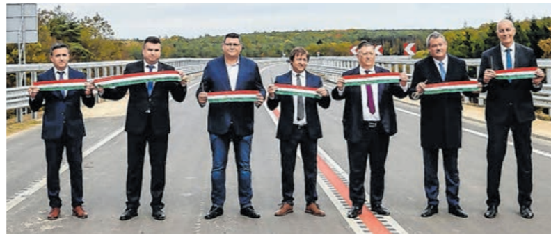
A hivatalos szalagvágás a vasszentmihályi völgyhídnál volt

Mosóczy László , az Innovációs és Technológiai Minisztérium közlekedéspolitikáért felelős államtitkára ünnepi beszédében hangsúlyozta, azzal, hogy elkészült az M80-as autótú Vas megye nyugati szegletében, egy újabb ékkel gyarapodott az útprogram amúgy is gazdag láncszemeinek a sora. Rámutatott: a kormány korábban sosem látott nagyságrendű fejlesztéseket hajt végre rendkívüli tempóban a hazai közúthálózaton. Azon dolgoznak, hogy a hazai közutak az ország minden részében európai színvonalú hozzáférést biztosítsanak és mielőbb bármely településről harminc percen belül elérhető legyen egy négy sávú út. A közúti közlekedés-fejlesztési terveket összegző útprogram teljes költségvetése mára már meghaladja a 3600 milliárd fo-