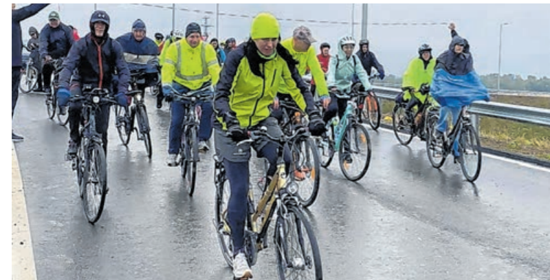
Civil kezdeményezésre a hivatalos átadás előtt néhány nappal lehetőség volt az M8 gyorsforgalmi utat egy kerékpártúra keretében végigjárni. Az út során végigtekertek a résztvevők a Vasszentmihály–Rönök között épített völgyhídon, emellett lehetőség volt gyalogosan a völgyhíd alatt is körülnézni