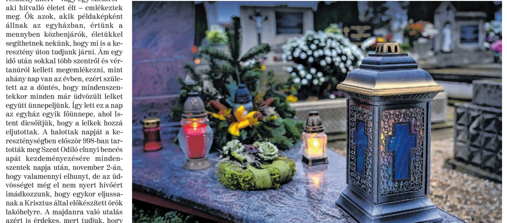
A földi létből eltávozott hozzátartozóink sírjára az emlékezés virágait helyezzük, mécseseket gyújtunk, a gyertya Krisztus jelképeként egyszerre szimbóluma a halandóságnak, az örök életnek, az örök világosságnak