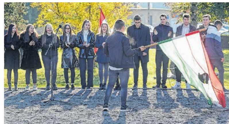
Színvonalas műsort adtak a Rázsós diákok