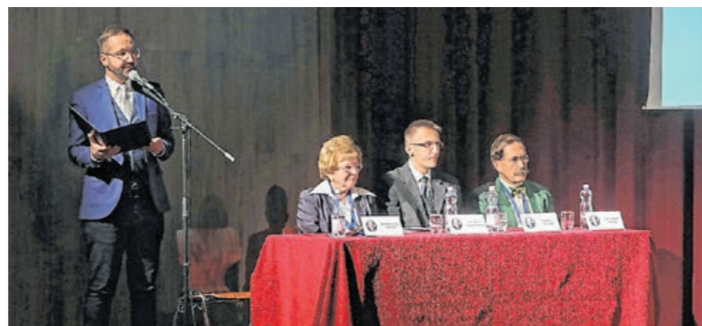
A résztvevők érdekes előadásokat hallhattak a hercegorvos kapcsán

A folytatásban V. Németh Zsolt betegsége miatt kabinetfőnöke tol-