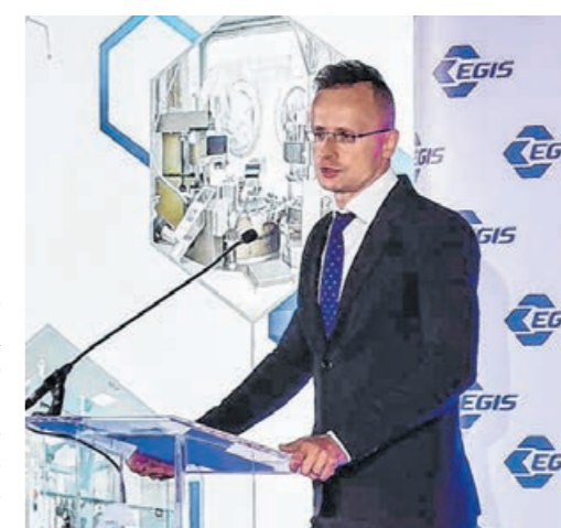
Szijjártó Péter szerint a magyar gazdaság dimenzióváltása nem lassult le, sőt fel is gyorsult a koronavírus-járvány alatt, amiben a gyógyszeriparnak hatalmas szerepe volt

delkezik, mégis Magyarországra hozta az új beruházását, ami hatalmas elismerés – hangsúlyozta Szijjártó Péter , majd gondolataiban