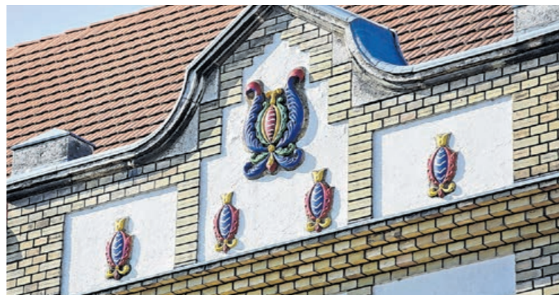
A Zsolnay-címer 1989-ben, a rendszerváltás idején került vissza az eredeti helyére