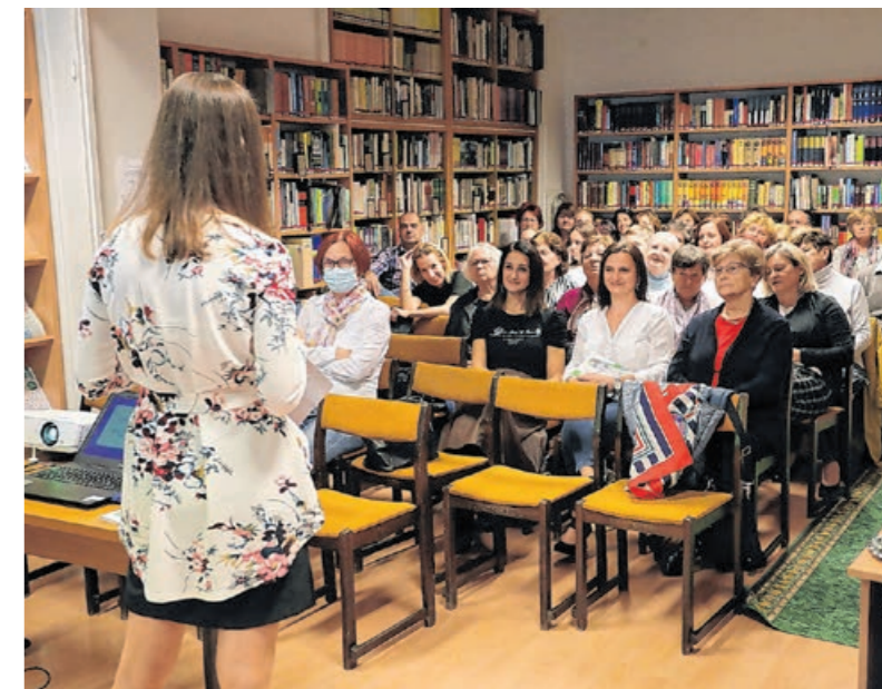
Sok volt az érdeklődő a könyvbemutatóon