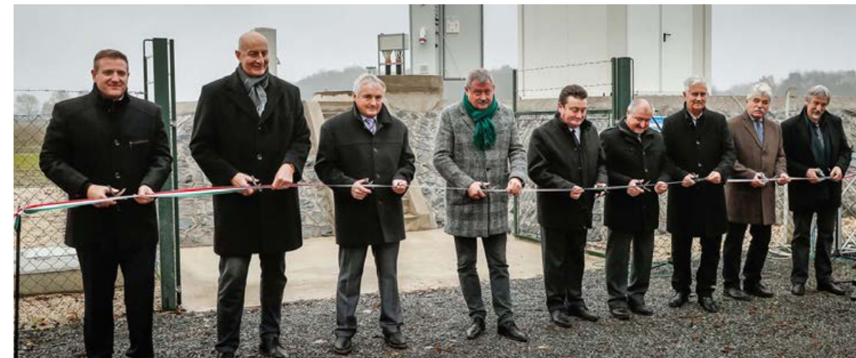
A körmenyi városvezetés hozzájárulásával köthettek rá a települések az itteni szennyvíztisztítóra