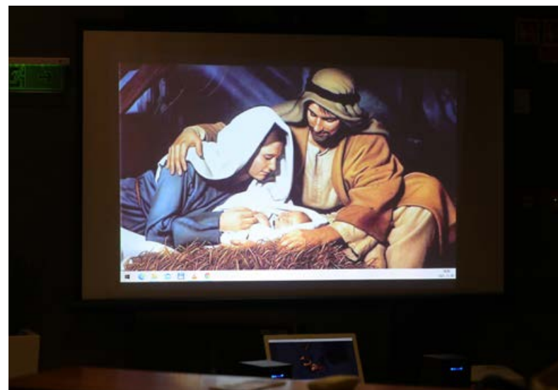
Betlehem: a Messiás születési helye

Aki nem olyan, mint Jézus, az nem keresztény, és József egyre jobban elkezdett hasonlítani Jézusra. Tiszta, szent ember volt, aki mindeztől Isten tetszését kereste. Megtanulta, hogy miképp éljen együtt egy ilyen tökéletes asszonnal. Isten elemi megérintettségével segítőként állt Mária és Jézus mellett. Józsefről akkor esik utoljára szó a Szentírásban, amikor a 12 éves Jézus szüleivel Jeruzsálemben záródik. Erekllyéi nem maradtak meg, sírja feltételezhetően a názáreti Angyali üdvözlés-bazilika alatti barlangban vagy a jeruzsálemi Jozafát-völgyben volt. Szent József az egyetemes Egyház védőszentje, a keresztény házasságok és családok, munkások, kézművesek, ácsok, favágók, asztalosok, üldözők és a jó halál védőszentje, főünnep: március 19.