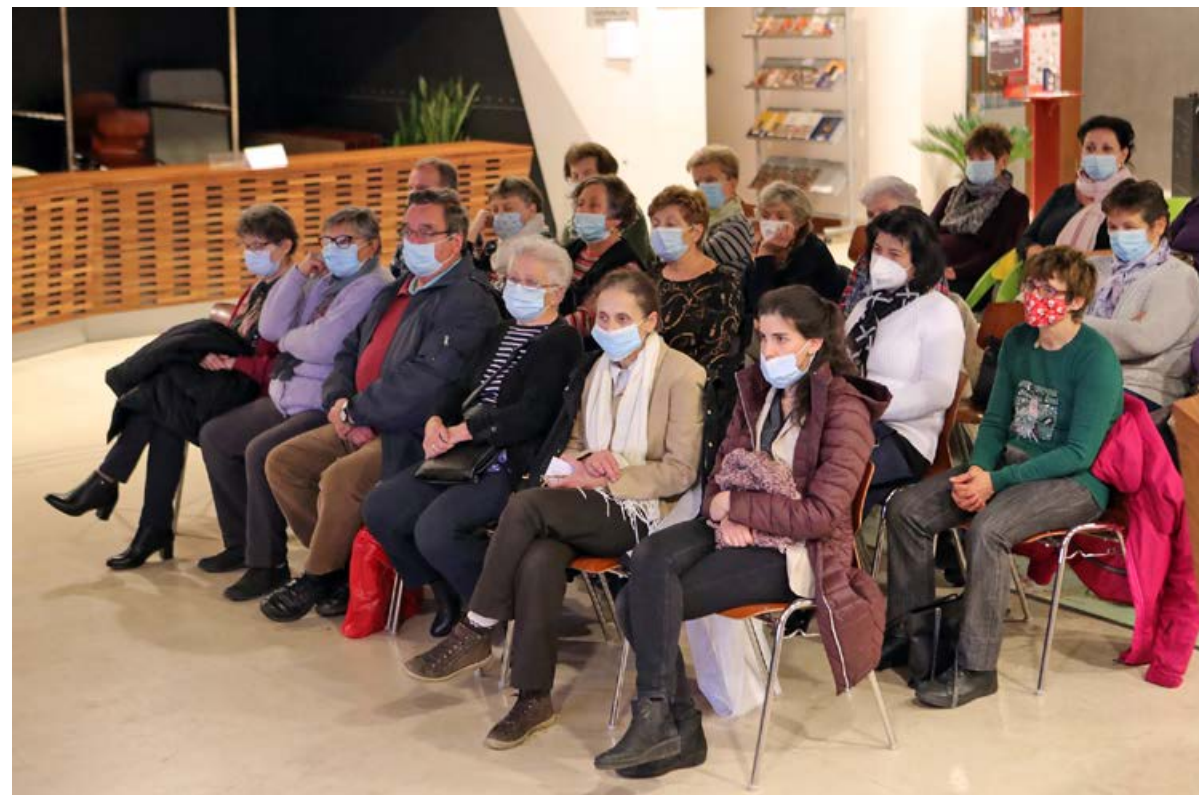
Az előadást a hatályos járványügyi előírásoknak megfelelően tartották

Amikor József eljegyezte Máriát, elindult egy új isteni élet. Minden hívő kereszténnyel meg kellene hogy történjen ennek az új életnek a kialakulása, amikor az énköze száll alá az Isten, és befogad bennünket a családjába. Mária 12 éves koráig szolgált templomi szűzként a