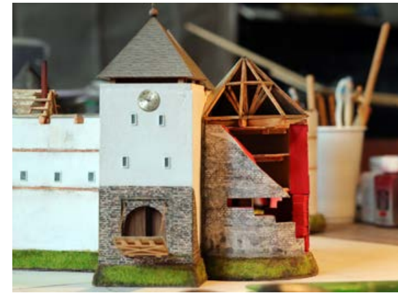
A készülő maketten az jelenne meg, hogy nézhetett ki a Batthyány-kastély az 1450-es és 1720-as évek között