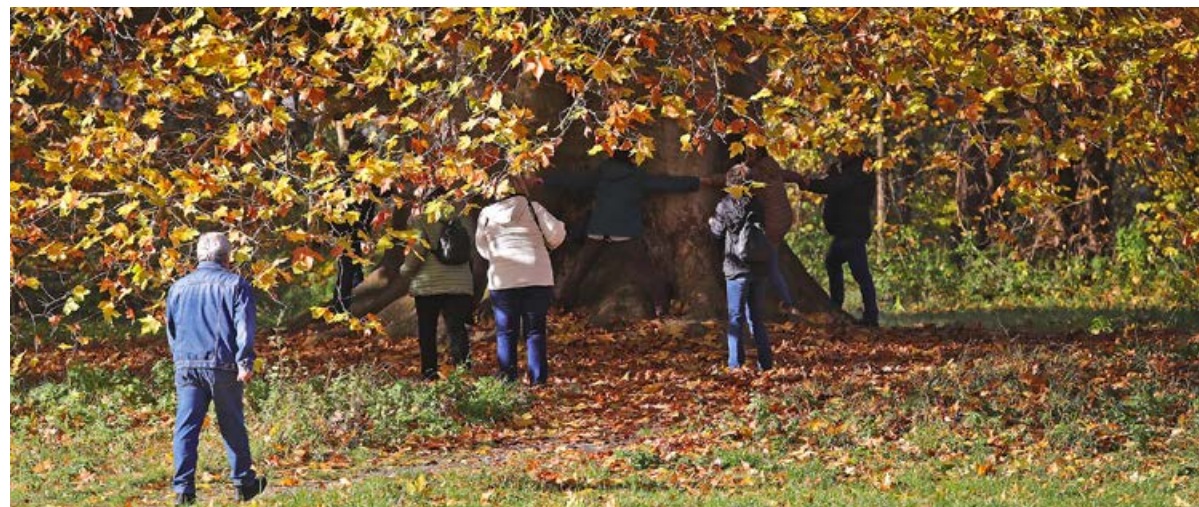
Sokat számítanak az emberi kapcsolatok, hogy testünk mellett szellemünket is fel tudjuk hozni a járvány előtti állapotra

Virulások című gyűjteménybe foglalta össze a vírus időszak alatt a közösségi oldalakon született írásait Gergye Rezső, a Nagy Gáspár Művelődési Központ igazgatója. A könyvet Körmenden is bemutatja a szerző december 6-án, hétfőn reggel hét és kilenc óra között a piacon.