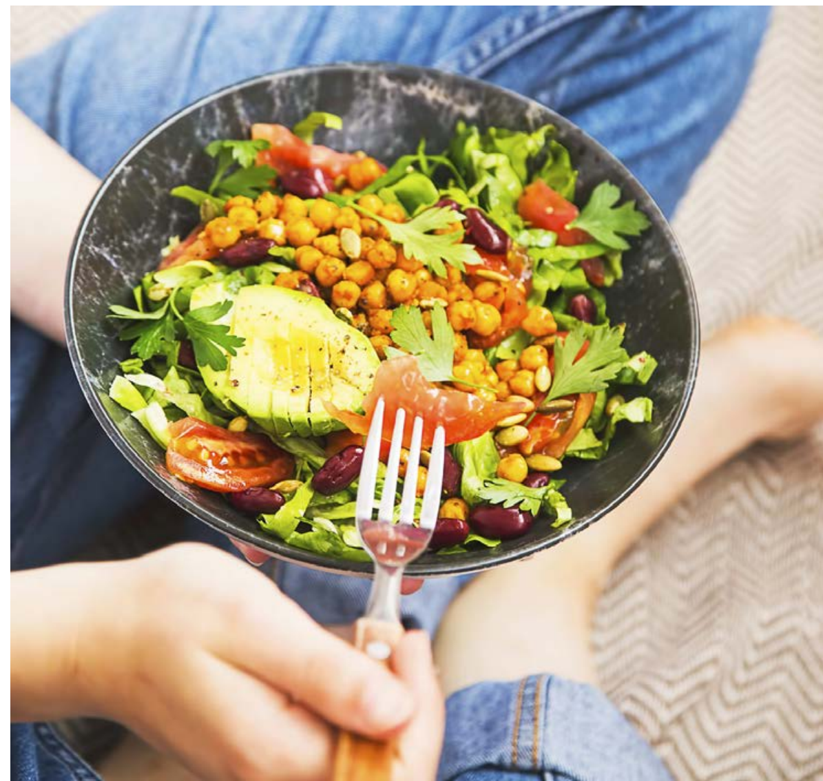
A sikeres fogyókúra 70 százalékát az étrend, 30 százalékát a mozgás révén érjük el

Sokan vagyunk, akik már többször próbálkoztunk különböző fogyókúrás módszerekkel, ám az eredmény nem mindig volt tartós. Vajon mit csináltunk rosszul, hogy a leadott kilóknál még több jött ránk vissza a későbbiekben? A titok nem csak az akaraterőn múlik, a tudatos életmódváltás és a személyre szabott étkezés, valamint a mozgás eredményezhet látható, ám hosszú időn át is megtartható, sikeres súlyvesztést.