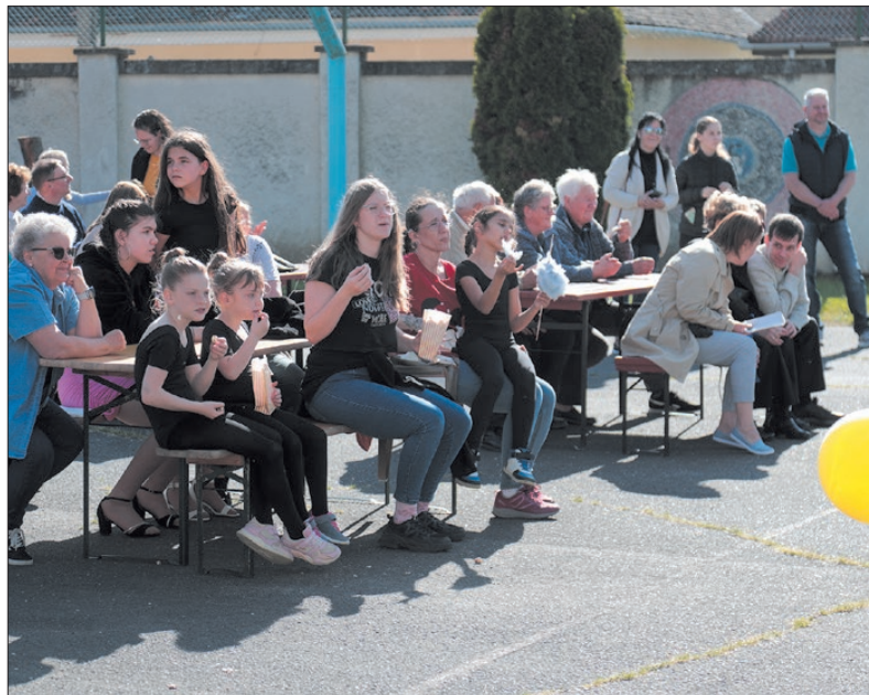
Ez a családi délután lehetőséget adott a helyi közösség számára, hogy megismerkedjenek a művészeti oktatás és a hagyományok gazdag világával