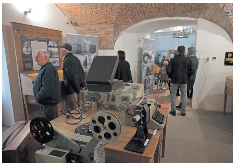
Nagy érdeklődés kísérte a kiállítást