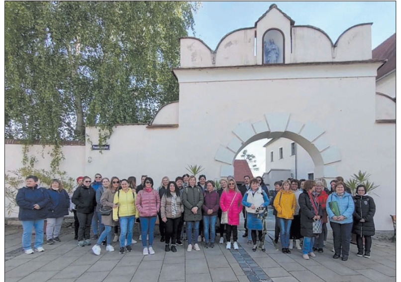
Az intézményrendszerhez tartozó kollégák a kirándulás első állomásán.

A kriptá leghíresebb halottja az 1870-ben született Boldog Batthyány-Strattmann László, a „szegények orvosa”, Coreth Mária Terézia hitvese, kinek földi maradványait boldog-