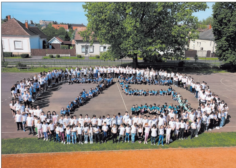
Élőkép az olcsais diákoktól. Emlékezős jubileum volt

Mindkét intézmény sikeres zárta jubileumi rendezvényét. A diákok nemcsak közös élményekben gazdagodtak, de eközben hagyományait is ápolták, s bizony mindkettő fontos a jövő iskolájához. (További képek és érdekességek a témanapokról az iskolák honlapján: olcsai-iskola.hu, somogyi-iskola.hu oldalon.) ■ FMP