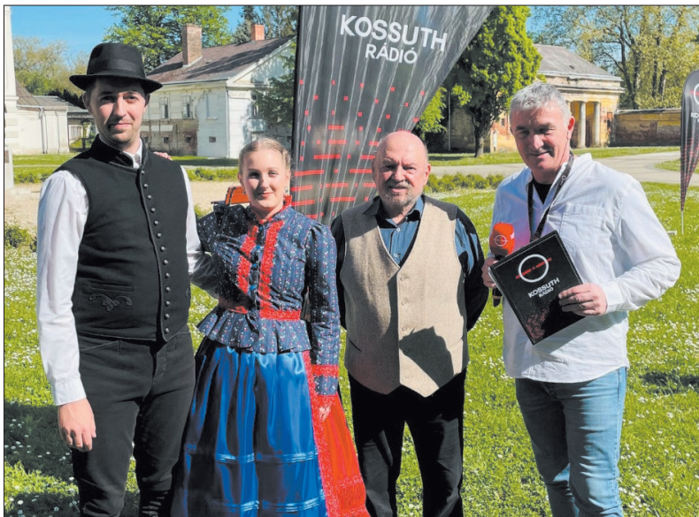
A Béri Balogh Ádám táncegyüttes is szerepelt a rádióban