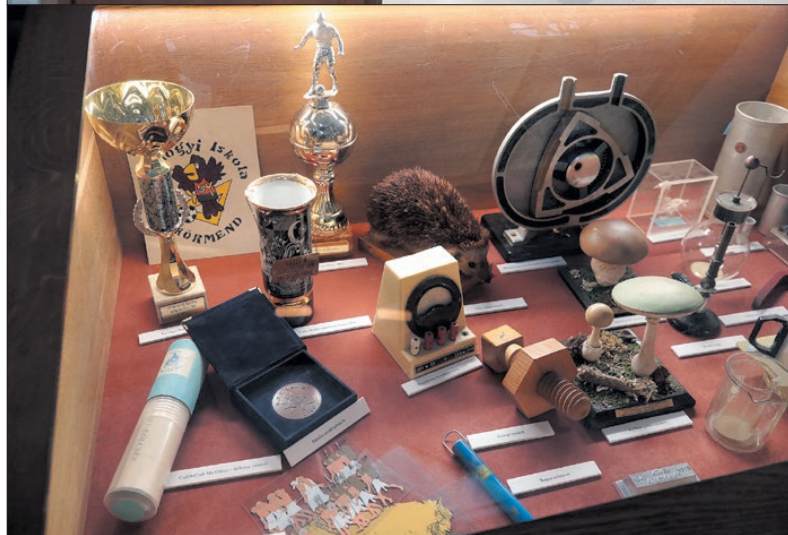
Oktatástörténeti időutazás a Dr. Batthyány-Strattmann László Múzeumban

idejében megteheti. Hétfő kivételével minden nap 18 óráig várja látogatóit a Dr. Batthyány-Strattmann László Múzeum. E kiállítás látogatása ingyenes, de csoportok esetén javasolt az előzetes bejelentkezés