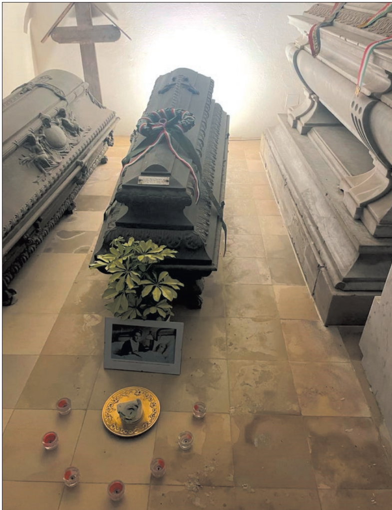
Sarlós-Boldogasszony templom alatt található a Batthyányiak temetkezési helye