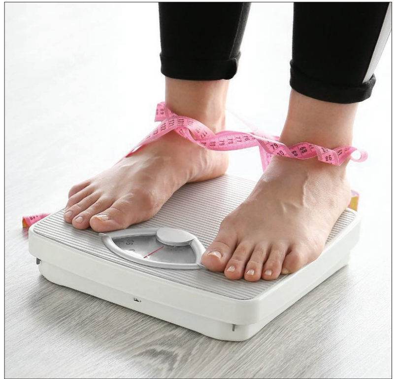
Magunkat ugyan becsaphatjuk, de a mérleg nem hazudik...

Az ülésen kívül a stressz is okozhat fáradtságot.