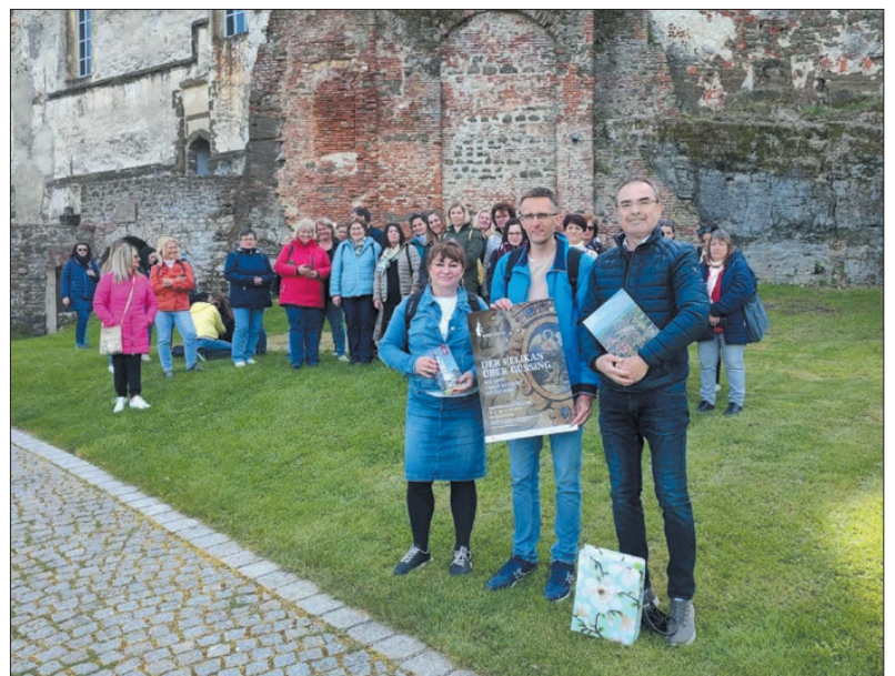
A templom után a várban tettek látogatást