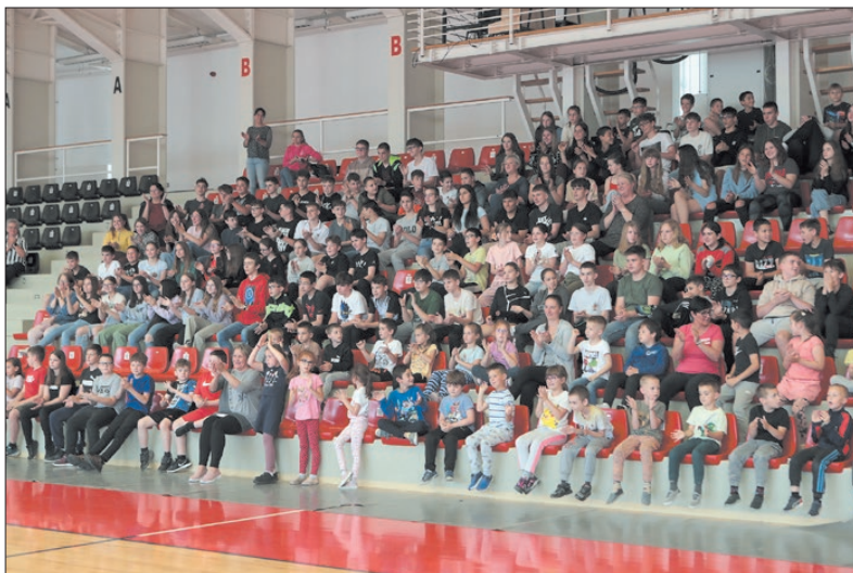
A nézőtér tele volt kíváncsi emberekkel