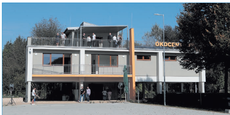
Végre megnyithatja kapuit az Ökocentrum