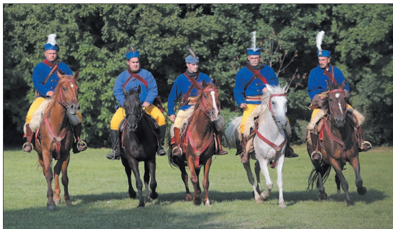
A körmendi huszárok minden jelentős helyi rendezvényen ott vannak, nélkülük nincsenek ünnepeknapok