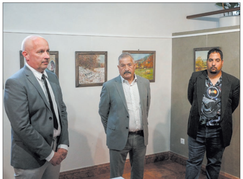
A kiállítás a Batthyány Örökségközpontban volt látható