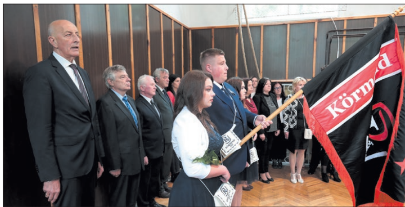
A Rázsó diákjai a tornateremben búcsúztak iskolájuktól