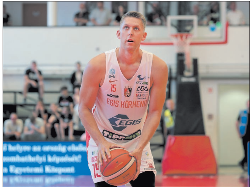
Fepu az Egis Körmend színeiben jutott túl a 7000. ponton

pályafutása során újabb mérföldkőhöz érkezett. A közönségkedven, a mindenki által Fepunak hívott kosaras az utolsó mérkőzésen megdobta 7000. pontját az Egis Körmend színeiben, adta hírül a Rába-parti klub honlapja. Fepu egészen pontosan 7001-nél tart, mindezt végig egy klubban, Körmenden. (A legtöbb hárompontos ranglistát már régóta vezet, 1465-öt süllyesztett el eddig a gyűrűben). A korábbi válogatott sportoló a magyar bajnokságok történetében a nyolcadik legtöbb pontot dobott kosárlabdázó. Csak egy aktív játékos, Vojvoda Dávid (Alba Fehérvár) előzi meg. MW