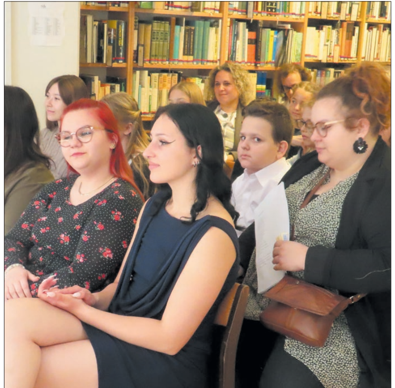
A szavalóversenyt három korosztályban szervezték