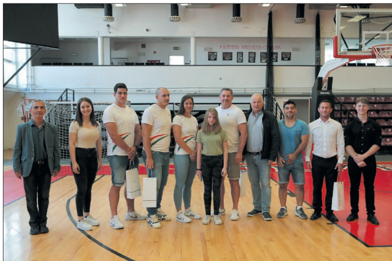
Kiváló sportolókat, példaképeket fogadott a jubiláló Somogyi

Ahogy a Somogyi iskola szerényen és jókedvűen ünnepli 50 éves szülinapját, úgy maradtak szerények és jókedvűek vasi olimpikonjaink is. ■ LÁSZLÓ ZOLTÁN