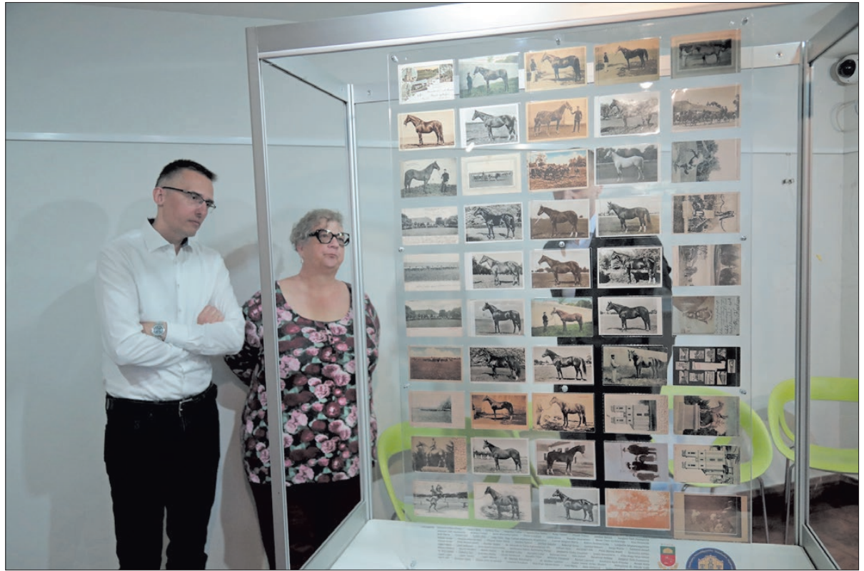
A „békebeli” Kisbérrel az itt látható képeslapokon keresztül május 26-ig ismerkedhetnek meg az érdeklődők

Aztán volt olyan időszak is, amikor ugyanaz volt a birtokosa Kisbérenek és Körmendnek, mégpedig Batthyány Gusztáv és öccse, Kázmér, aki kuzinja, Batthyány Lajos miniszterelnöksége alatt külügyminiszter volt. Érdekes, hogy előbbi, vagyis Batthyány Gusztáv kezdett angol telivéreket tenyészteni a kisbéri birtokon, ahol aztán 1874-ben világra jött Kincsem. Igaz, ebben az időben már nem