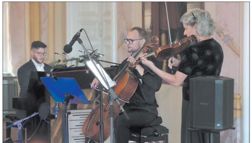
A tanárok a színpadon is jól érzik magukat

A rendezvényre várták azokat, akik szeretik élvezni a klasszikus komolyzenét, valamint azokat is, akik kíváncsiak arra, hogyan ötvöződnek a hagyományos műfajok a mai modern